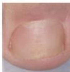
Dopo il trattamento

Se non osserva miglioramenti dopo 3 mesi deve consultare il medico.