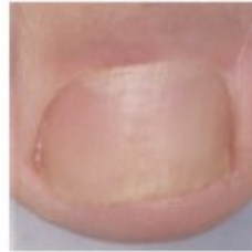
Dopo il trattamento

Se non osserva miglioramenti dopo 3 mesi deve consultare il medico.