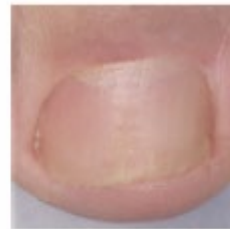
Prima del trattamento